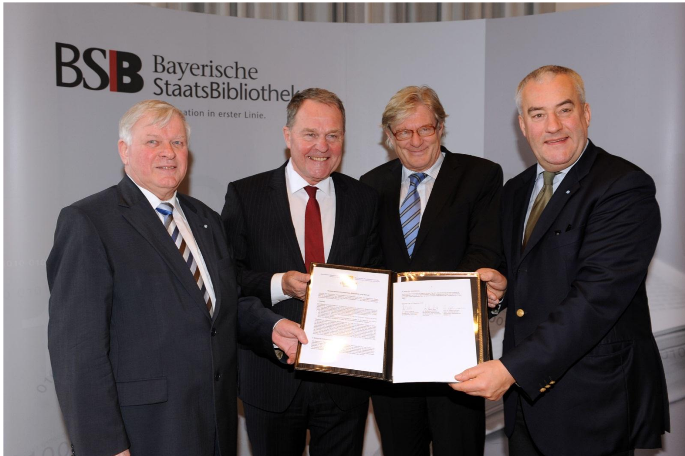
Kooperationsvereinbarung „Bibliothek und Schule“ (BSB, 10.12.2012)